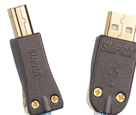
Kontakter för lödanslutning